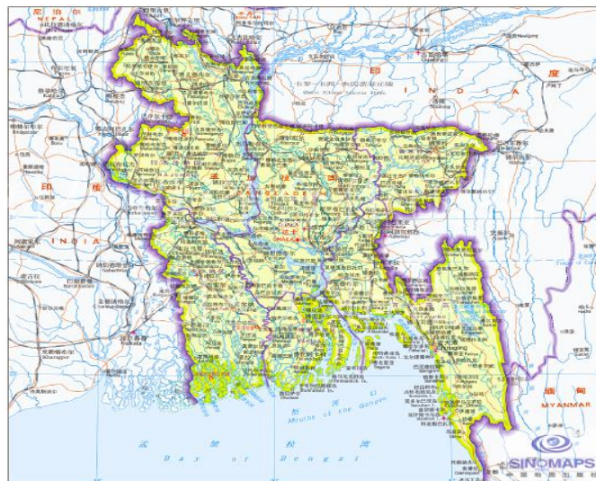
图 1 孟加拉国地图

孟加拉国首都达卡（Dhaka）是全国政治、经济、文化中心，属东六时区，比北京时间晚 2 小时，人口约 2123 万。吉大港市（Chittagong）是孟加拉国最大的港口城市和全国第二大城市，人口超 505 万。孟加拉国 80% 的国际贸易及 40% 的工业产值均产生于吉大港。云南省昆明市是吉大港友好城市之一。